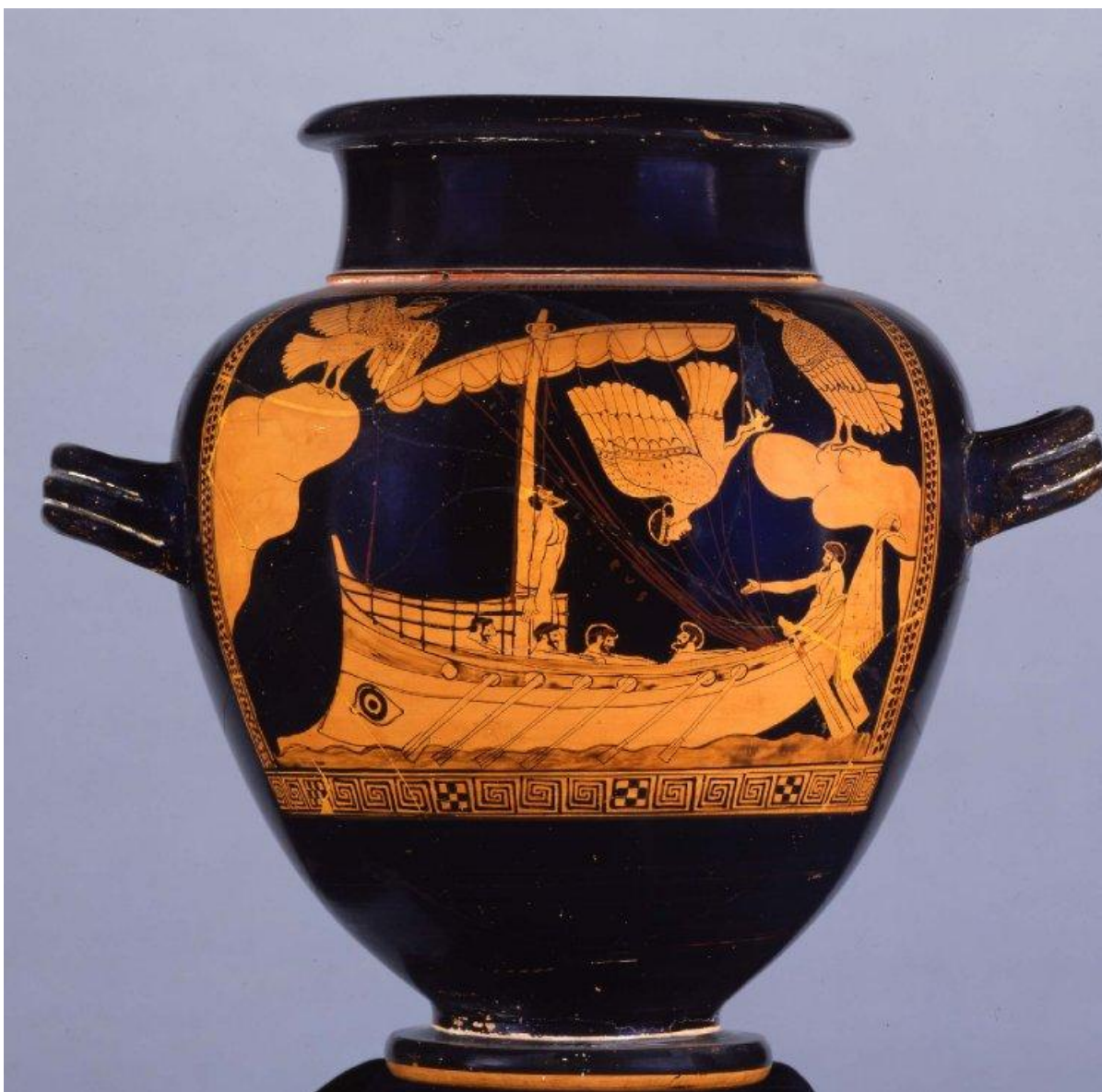
CVA British Museum 3 III Ic Pl. 20, 1

Neste stamnos temos, como unidades formais mínimas , 4 signos que nos remetem ao mundo marítimo: